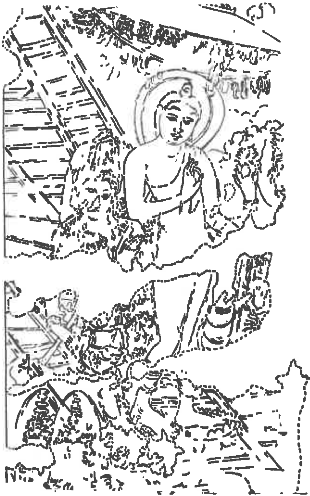
බුදුන් රන් විමානයේ රන් හිනිමගෙන් සංකීස්ස පුරයට වැඩීම දක්වන සිතුවම, පොළොන්නරු විහු ශික්ෂණයේ ප්‍රබලතම ප්‍රකාශනය යි.