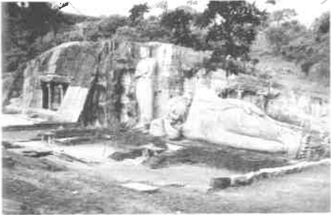
ගල්විහාරයේ බුද්ධ ප්‍රතිමා