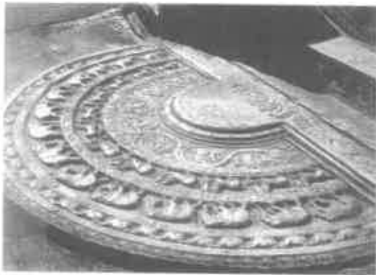
පොළොන්නරුවේ විටදගෙය දොරටුවේ - සඳකඩපහණ