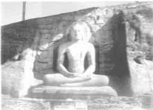
ගල්විහාරයේ වැඩිහුන් සමාධි ප්‍රතිමාව