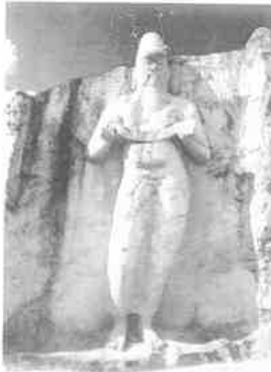
මහාපරාක්‍රමබාහු රජුගේ යයි සැලකෙන ප්‍රතිමාව - පොත්ගුල්වෙහෙර