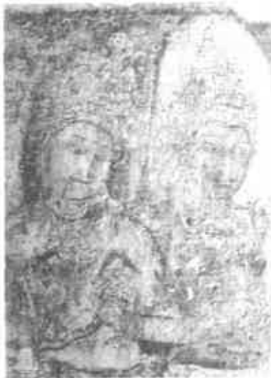
තිවංක ප්‍රතිමා ගෘහයේ දෙවියන් දැක්වෙන සිතුවම්