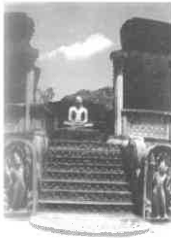
පොළොන්නරුව වටදගේ බුදු පිළිමය